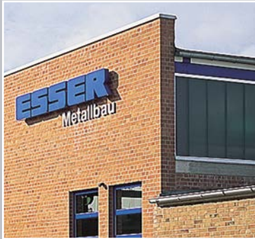
Betriebsstätte 1 Euskirchen, Eifelring