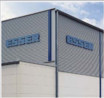
Betriebsstätte 2 Euskirchen, An der Vogelrute